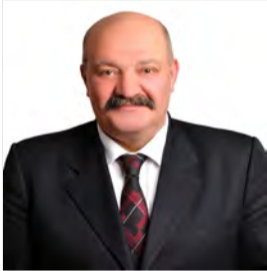
Мурат Бахадыр Аккюнюлу

https://www.trthaber.com/haber/gundem/fetonun-ust-duzey-ismi-orhan-inandi-ankarada-sorguda-594477.html