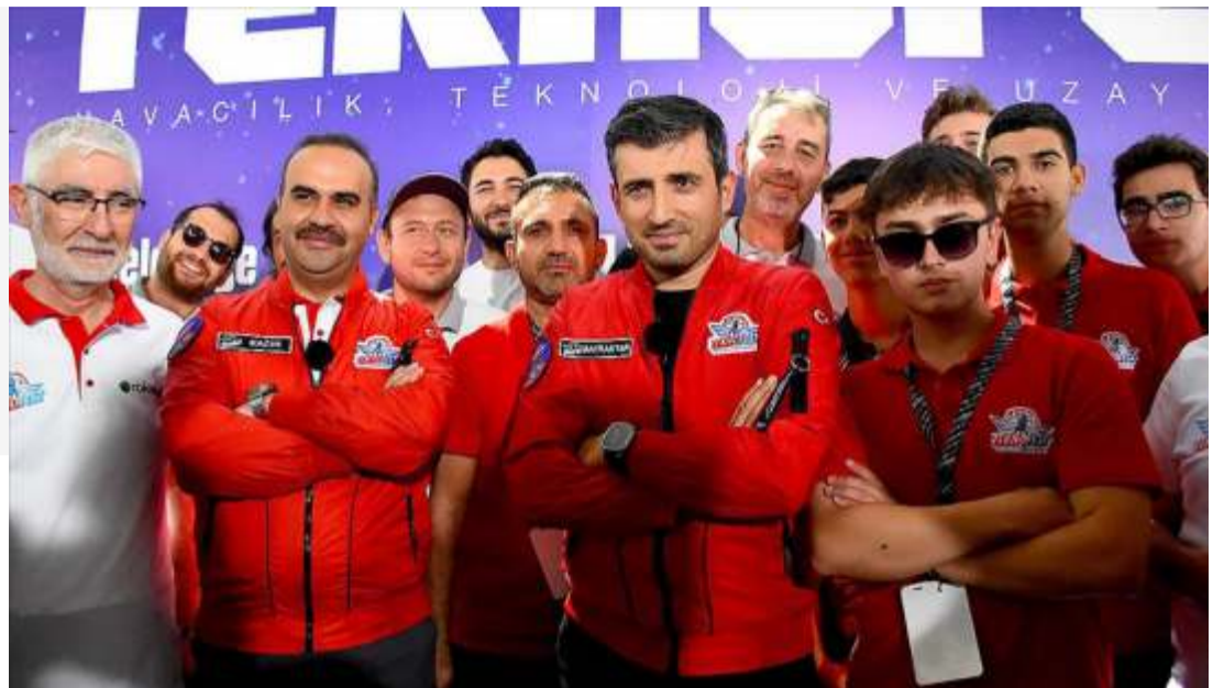
Президентство оборонной промышленности и всех, кто внес свой вклад в поддержку ТЕКНОФЕСТ. .

Заявив, что волнение турецкой молодежи также выявило интерес к ТЕКНОФЕСТ, Каджыр отметил: «Это можно объяснить только заявлением о том, что флаг развевается с лунной звездой, а не с обильной звездой в небе. С позволения Аллаха мы продолжим стоять плечом к плечу с нашей молодежью на пути национальных технологий и идти по этому пути спина к спине. Я надеюсь, что вместе мы побьем много рекордов и продолжим вместе ставить подпись Турции в небе». Каджыр поблагодарил команды, участвовавшие в гонках на ракетах и всех гонках, организованных в рамках ТЕКНОФЕСТ, семьи и учителей, которые поддерживали молодежь, а также ROKETSAN, Фонд ТЗ,