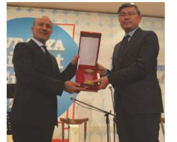
2018 Avrasya Hizmet Ödülü Sivil Toplum Kuruluşları Dalında Başkent Uluslararası Barış ve Kardeşlik Platformuna layık görüldü.