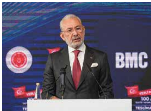
Sıra Altay tankında

"Kara araçları konusunda müjdemiz ve beklentimiz, bu yılın ikinci yarısının hemen sonunda ana muharebe tankımızın seri üretimden çıkararak kahraman ordumuza teslim edilmesi. Bu önemli bir gelişme olacak. Bununla beraber kamikaze çalışmalarımız, M60 tanklarının ayda en az iki tane teslim edilecek şekilde tamamlanması, zırhlı amfili hücum araçlarının teslimatlarının yapılması. Yine yeni nesil 6x6, 8x8 araçlarımızın sözleşmelerinin imzalanması, özel amaçlı teknik tekerlekli zırhlı araç ÖMTTZA'ların 5 farklı varyantta konfigürasyonların ve kalifikasyonlarının tamamlanması. GZPT ve ZMA modernizasyonu kapsamında olan araçlarımızın teslimatı 2025 yılındaki kara araçları bakımından faaliyetlerimiz içinde yer alacak."