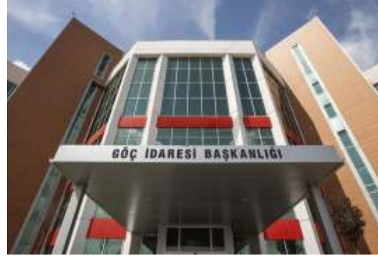
"Sevklar kapasite yönetimi kapsamında yapılmakta"

İlgili mevzuat gereği geri gönderme merkezinde çalışan personellere "kötü muamele yasağının yazılı ve sözlü olarak tebliğ edildiği" aktarılan açıklamada, temel insan hakları başta olmak üzere çeşitli eğitimler verildiği bildirildi. Geri gönderme merkezlerinin uluslararası sözleşmeler ve iç hukukta yer alan kurumlar tarafından haberli ve habersiz olarak sürekli denetlendiği belirtilen açıklamada, 2024'te 631 denetim ve 134 ziyaret gerçekleştirildiği ifade edildi. Açıklamada, "Tüm geri gönderme merkezlerinde barınanlara yemek, temizlik, havalandırma, sağlık hizmetlerine erişim, avukata ve adli yardıma erişim, ailesi ile görüşme, dış dünya ile iletişim, psikososyal destek hizmetleri, tercümanlık, ibadet odaları, dilek-şikayet mekanizması ve benzeri hizmetler kesintisiz olarak sunulmaktadır." bilgisi paylaşıldı. Geri gönderme merkezlerinde idari gözetim altında bulunan yabancıların görüşmelerini, avukat-müvekkil mahremiyet kurallarına uygun olarak görüşme odasında gerçekleştirdiği belirtilen açıklamada, "Hukuki yardıma erişimde sistemin eksiksiz çalışmasına engel teşkil eden herhangi bir durum bulunmamaktadır." ifadeleri yer aldı. Gözetim altında bulunan yabancıların avukatlarıyla görüşme sayılarının kayıt altında tutulduğu aktarılan açıklamada, bu yıl geri gönderme merkezlerine 27 bin 390 avukat geldiği ve 239 bin 664 görüşme yapıldığı kaydedildi.