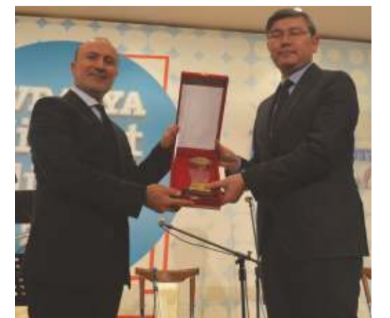
2018 Avrasya Hizmet Ödülü Sivil Toplum Kuruluşları Dalında Başkent Uluslararası Barış ve Kardeşlik Platformuna layık görüldü.